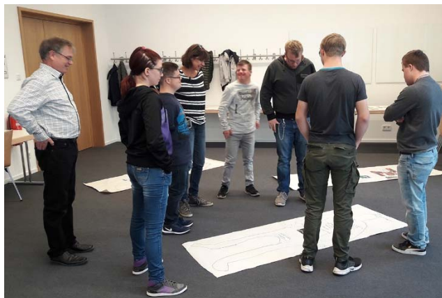
Abbildung 1: Träume, Wünsche und Ziele, geschrieben auf Körperumrissen

aufgeteilt, die jeweils ein Puzzle fertigstellen sollen. Was die Teilnehmenden nicht wissen: Ein Puzzleteil stammt aus der jeweils anderen Gruppe. Um das Problem zu lösen, müssen die Gruppen miteinander reden und die Puzzleteile tauschen. Im Anschluss an diese Übung wird festgehalten: Viele Probleme können wir alleine nicht lösen; wir brauchen also andere Menschen, die sich (gemeinsam mit uns) für unsere Interessen einsetzen. Zur Sprache kommen dabei auch Interessengruppen wie das Netzwerk People First Deutschland e. V. , die sich dafür einsetzen, dass Menschen mit Lernschwierigkeiten mehr Rechte erhalten.