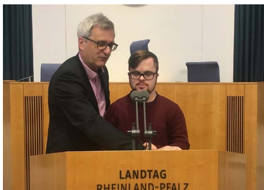
Abbildung 2: Veranstaltung »Ich bin Politik«, Besuch im Landtag, © Fridtjof-Nansen-Akademie für politische Bildung

In dieser Phase werden verschiedene Themen gesammelt, mit denen sich Politiker*innen auseinandersetzen. Die Teilnehmenden werden aufgefordert, aus einer Auswahl verschiedener Themen diejenigen auszuwählen, für die sie selbst besonderen Handlungsbedarf sehen. Um konkret auf die ausgewählten Themen einzugehen, wird die Gruppe in zwei Kleingruppen aufgeteilt, in denen Videos zu den Themen angesehen werden. Zu den Videos stellen die Kursleiter*innen gezielte Fragen, die von den Teilnehmenden beantwortet werden. Aufbauend auf dem angeeigneten Wissen formulieren die Teilnehmenden selbst offene Fragen zum Thema.